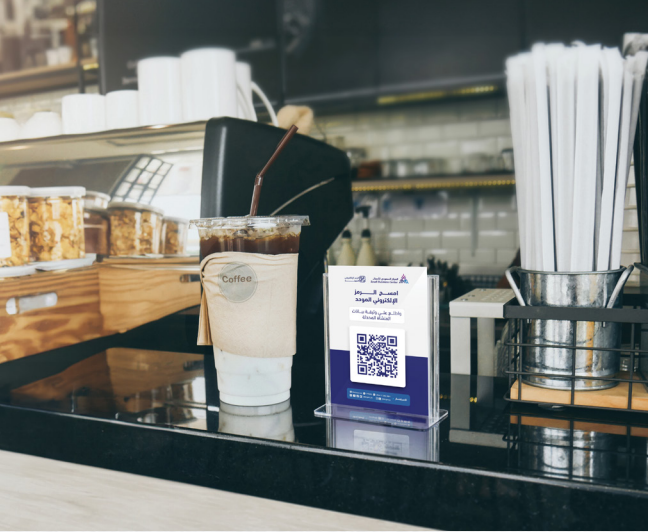
طاوله الاستقبال 0