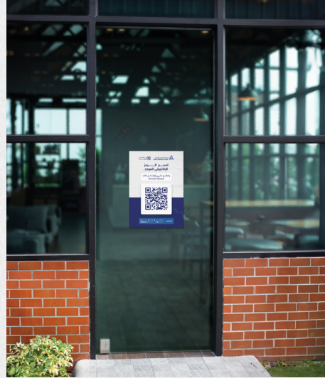
واجهه المنشأة 0